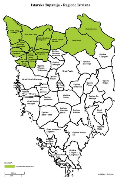
Slika 1: Karta LAG područja s vidljivim granicama JLS-ova u LAG-u